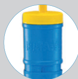
Accionamiento ergonómico de manejo simple